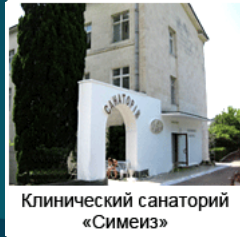
Клинический санаторий «Симеиз»