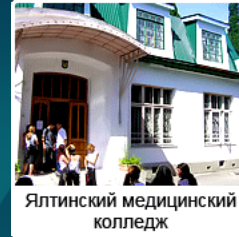
Ялтинский медицинский колледж