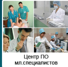
Центр ПО мл.специалистов